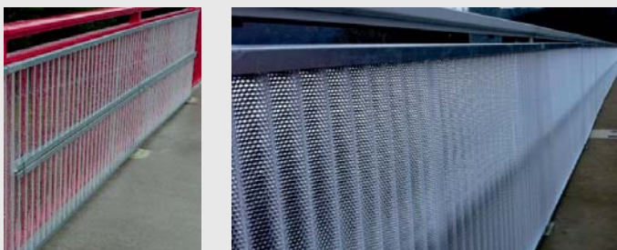
Brückenverkleidung mit Wellplatten