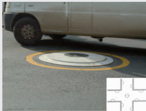
Mini-Kreisverkehr Small roundabout

A round island is composed of 2 semicircles, which can be easily put together. The semicircles can also be used individually as peninsulas.