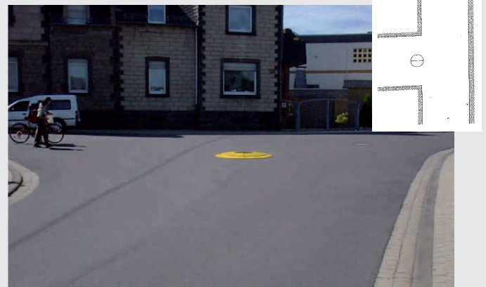
Beruhigungsinsel an einer Straßeneinmündung Soft speed reducer on a street junction