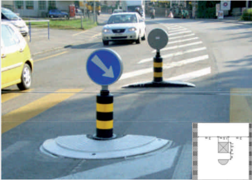
Fußgängerfurt mit Halbinseln Pedestrian ford with semicircles

Eine kreisrunde Insel setzt sich aus 2 weithin sichtbaren Halbscheiben zusammen, die problemlos zusammengesetzt werden können. Die Verwendung eines einzelnen Elements als Halbinsel ist ebenfalls möglich.