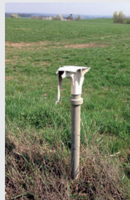
Schäden durch Winterdienst damages through snow clearing