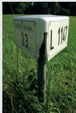
Schäden durch Mäharbeiten damages through mowing