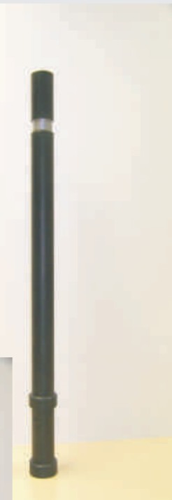
Funktionsweise des Spezialkunststoffes / Function of the special synthetic: