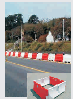
Leitwände / guide walls