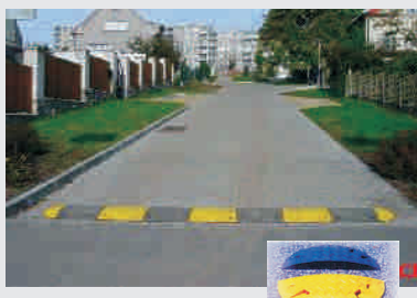
Tempohemmschwelle / speed bump