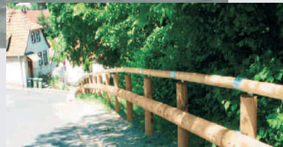
NATUR-RAIL mit Aufsatzgeländer

Die fachgerechte Lösung um Wege- und Straßen- ränder für Fußgänger und Radfahrer naturnah und sehr sicher zu gestalten.