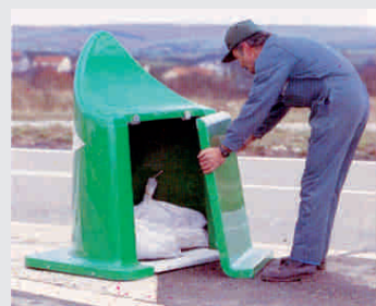
Richtungspfeiler an Ausfahrten, Fahrbahntrennungen etc. / Pierhead on exits or directional islands