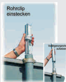
Rohr-Clip / tube extension