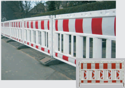
Absturzsicherung TL-geprüft / safety barriers