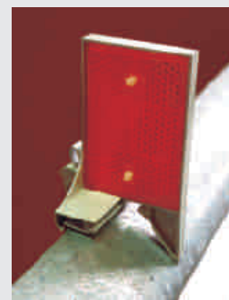
Reflektor auf Schutzplanken Typ A / Reflector for crash barriers