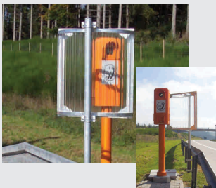
Notrufsäulenschutz / emergency phone protection

Aufhaltstufe N2 gemäß DIN EN 1317-2, exakt analog Stahlschutzplanke ESP BAST-begutachtet (Berichtsnummer 2002 7H 52/JF und 53/JF) NATUR-RAIL als Holzschutzplanke