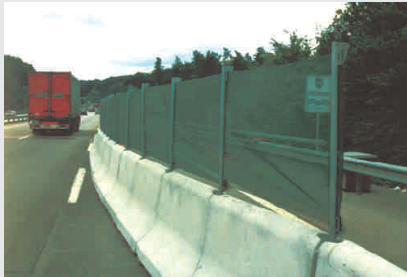
Baustellennetze als Abtrennung oder Sichtschutz / Construction site fence for separation or as visual protection