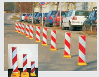
Standfüße / road marker

Zertifiziert: DIN EN ISO 9001:2000 SCC** 2006