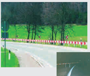
Kurvenleitprofil / guide profile