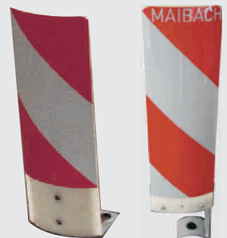
Leitfahne mit Stahlhalterung / delineators with steel holder