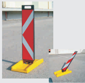
Mini-Klappbake / fold-down delineator