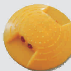
Bodennägel / ground markers

clip-on reflector easy installation: simply insert the reflector in the long hole of the crash barrier by use of our installation tool