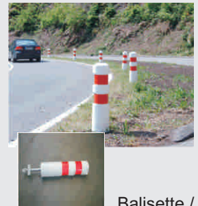
Balisette / soft bollard