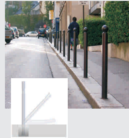
Rückstell-Poller / reboundable bollard