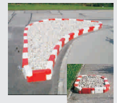
Mobile Randsteine / mobile kerbs