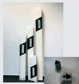
Leitpfosten / guide posts