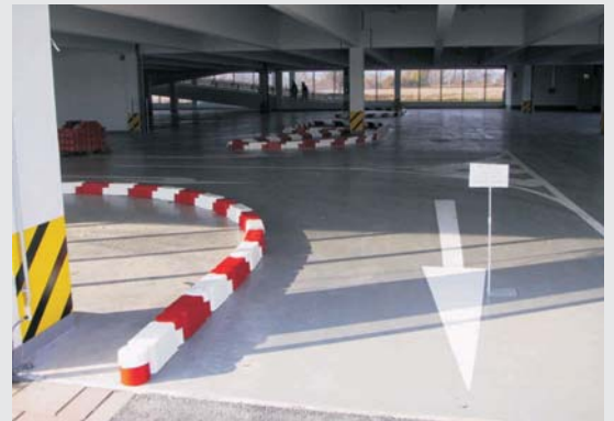
... Zur Verkehrsführung in Parkhäusern ... for traffic guidance in car parks