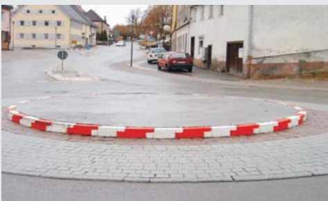
... Für Kreisverkehre ... for roundabouts