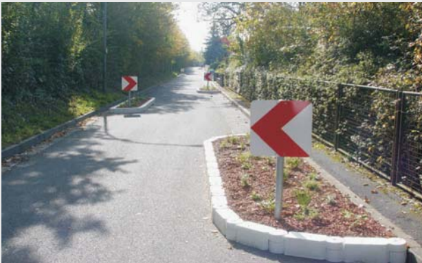
... Für Fahrbahnverengungen ... for road narrowing