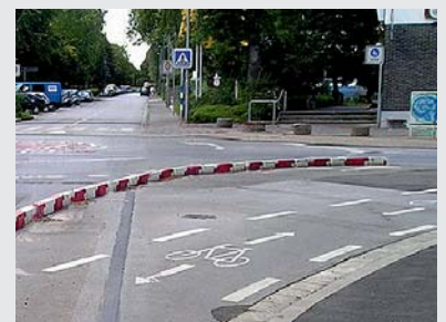
... Zur Sicherheit des Radverkehrs ... for cycling safety

... Die mobilen Randsteine sind auch mit Glasmarkierungsknöpfen erhältlich ... mobile kerbs are also available with glass markers