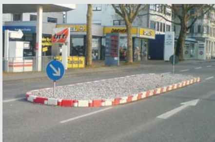
... Zur Erweiterung von Verkehrsinseln ... for traffic islands