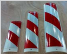
Leitfahnen / delineator: klein/ mittel/ groß/ small medium big 370 mm 530 mm 710 mm