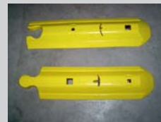
Anfangs-/Endstück / Endelement: 800 x 242 x 80 mm