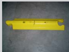
Leitschwelle / guide barrier: 1000 x 242 x 80 mm