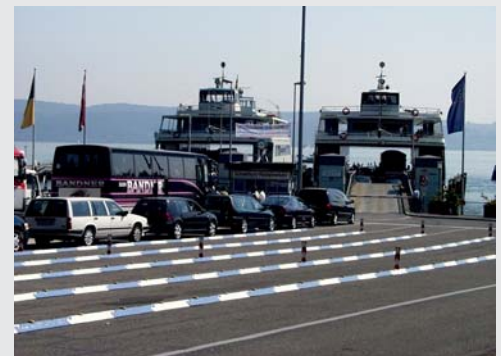
Wartespur-Trennung an einer Fähre Separation of queue-up lanes at a ferry

Die Leitschwelle ist sekundenschnell durch die Vater/Mutter-Verbindung montiert und wieder demontiert. Es kann ein Radius von mindestens 6 Grad verbaut werden. Dank speziellem Herstellverfahren keine Verformungsprobleme bei Wärme / Kälte. Durch Zugabe von Gummigranulat ist die Schwelle elastisch. Im Verbindungsbereich der Elemente werden beim Pressen zur Erhöhung der Festigkeit zusätzliche Versteifungen eingelegt. Ermittlung der optimalen, rutschfesten Form durch zahlreiche Anfahrtests.