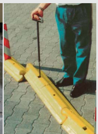
Problemloser Austausch mit Spezialhebewerkzeug Easy removal with special tool