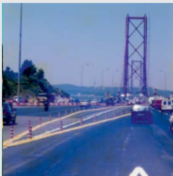
Zur Verkehrslenkung bei einer Autobahn-Zahlstelle To divert traffic in a toll station