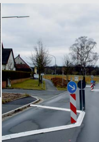
Winkelemente in einer Tempoeruhigungszone Corner elements in a residential zone

Winkelement - individuell auf Maß gefertigt Corner element - made individually according to request