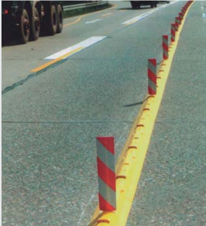
Fahrbahntrennung bei einer Autobahnbaustelle Lane marking in motorway roadworks