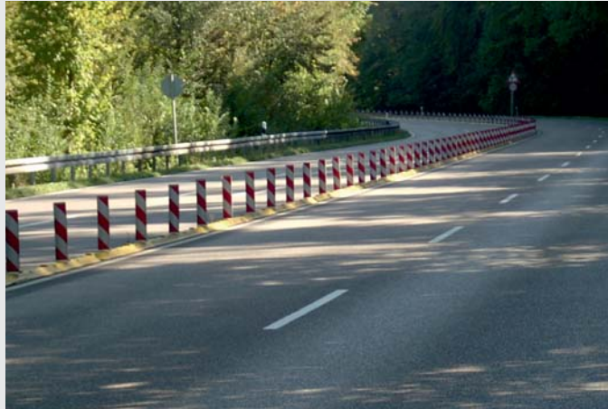
Fahrbahntrennung bei Überholverbot To prevent overtaking manoeuvres