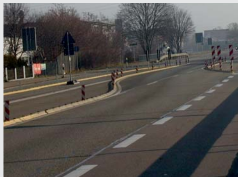
Zur Verkehrslenkung und Fahrbahntrennung To divert traffic and separate lanes