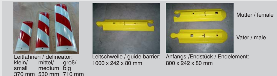
Leitfahnen / delineator: klein/ mittel/ groß/ small medium big 370 mm 530 mm 710 mm