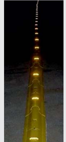
Nachtsichtbarkeit Night visibility