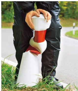
Gut: Kurvenmarkierung mit weichen »Balisetten«

Gemeinsam mit Verkehrsexperten sichtete der ADAC vielbefahrene Motorradstrecken. Die Erkenntnis: Es wurde schon einiges getan, doch es müssen noch viel mehr Gefahrenstellen entschärft werden