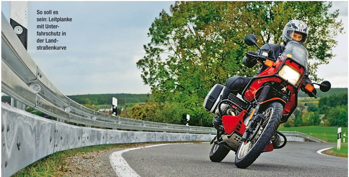
So soll es sein: Leitplanke mit Unterfahrschutz in der Landstraßenkurve