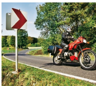
Schlecht: Starre und scharfkantige Kurvenleittafeln