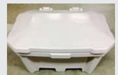
Sonderfarben auf Anfrage