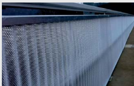
Brückenverkleidung mit Wellplatten