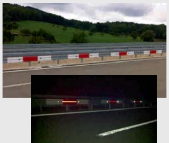
Kurvenleitprofil mit Reflektor