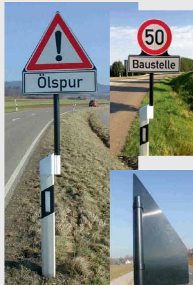
Klappschild aus Spezialkunststoff