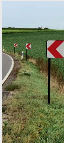
Richtungstafel aus Spezialkunststoff