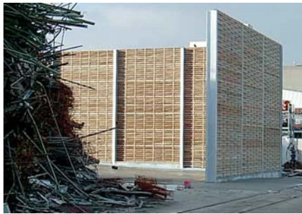
Lärmschutzwand an Recyclingbetrieb