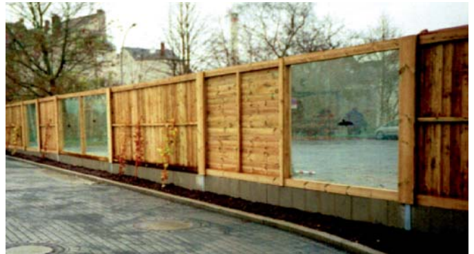
Lärmschutzwand aus Holz mit Acryl