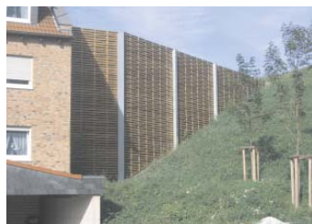
Lärmschutzwand an einer Wohnbebauung