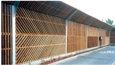
Lärmschutzwand an Parkplatzzufahrt

Die Elemente aus Holz können in unterschiedlichen Ausführungsvarianten geliefert werden. Von der preiswerten Flechtausführung bis zur Ausführung mit Halbrundlattung und rückseitiger Nut-Feder-Schalung. Die Elemente können reflektierend, ein- oder doppelseitig absorbierend geliefert werden.