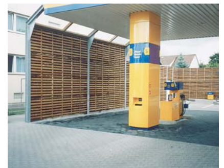
Lärmschutzwand an einer Tankstelle

MAIBACH VuL GmbH Bannholzstraße 4 D-73037 Göppingen-Voralb Telefon 0 71 61 / 99 76 0 Telefax 0 71 61 / 99 76 44 e-Mail: maibach@maibach.de