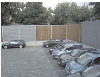
Lärmschutzwand an einem Parkplatz