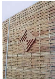
Lärmschutzwand mit Ornament