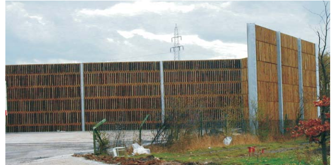
Lärmschutzwand bei einem Logistikbetrieb