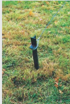
Hering und Seil peg and rope