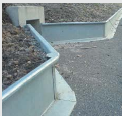
Stahl / Steel Standard

We also supply permanent installations made of steel and concrete, with all accessories such as tunnels, stop drains, equipment for catching and counting of populations and climbing aids. (see brochure „light version“ for further details)