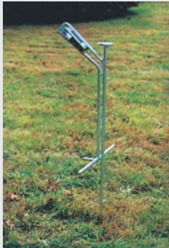
Haltepfosten, feuerverzinkt Support post, galvanized