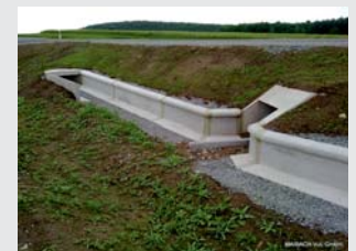
Beton / Concrete Standard