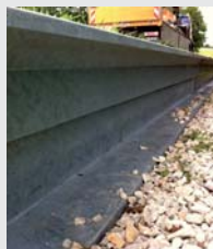
Stahl / Steel Ideal Sondervariante Laubfrosch-/Molchtauglich Special version proof for salamander and tree frog