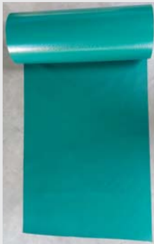
Gewebefolie Polyester foil