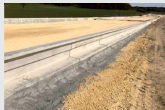
Beton / Concrete Ideal Sondervariante Laubfrosch-/Molchtauglich Special version proof for salamander and tree frog