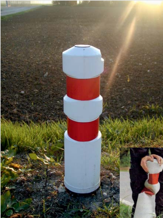
Balisette / Soft bollard

Soft bollard The way of indicating curves and obstacles