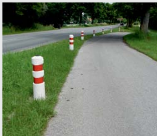
Zur Geh- und Radwegabtrennung bzw. Fahrbahntrennung Separation of road and bikepath or other lanes