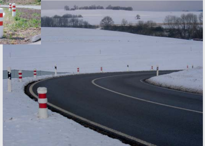
Kurven sichtbar machen (auch in der MVMot empfohlen) Indication of curves