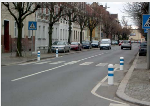
An Fußgängerüberwegen gemäß den Empfehlungen zur Gestaltung von Fußgängerwegen Richtlinien RFGÜ 2001 Pedestrian crossings