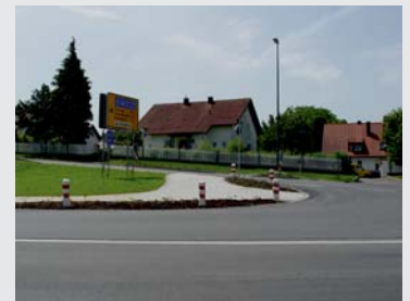
Zum Schutz der Bankette Shoulder protection