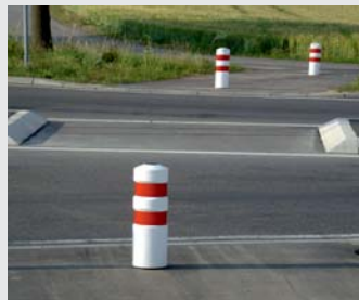
Als Durchfahrtssperre Ride through barrier