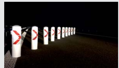
Weitere Varianten auf Anfrage / Other variants on request