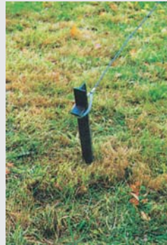
Hering und Seil peg and rope