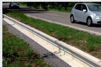
Beton / Concrete Sondervariante Laubfrosch-/Molchtauglich Special version proof for salamander and tree frog