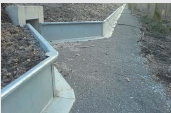
Stahl / Steel

We also supply permanent installations made of steel and concrete, with all accessories such as tunnels, stop drains and equipment for catching and counting of populations.