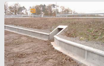
Beton / Concrete Standard