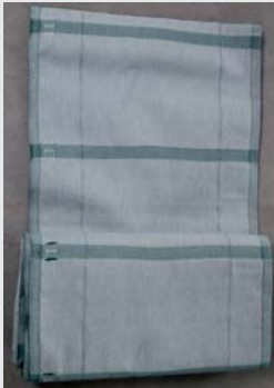
Spezialgewebe Protection fence