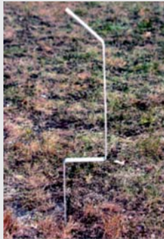
Haltepfosten, feuerverzinkt mit Spitze. Support post, galvanized.