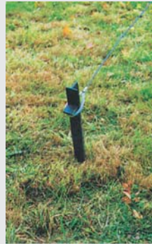
Hering und Seil Peg and Rope