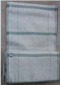
Spezialgewebe Protection fence