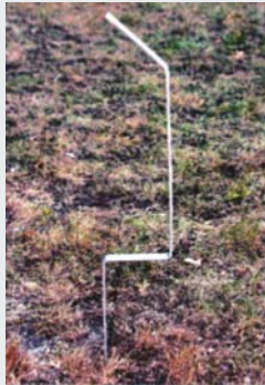
Haltepfosten, feuerverzinkt mit Spitze. Support post, galvanized.