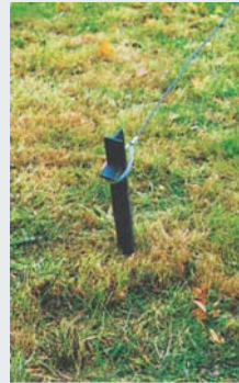
Hering und Seil Peg and Rope