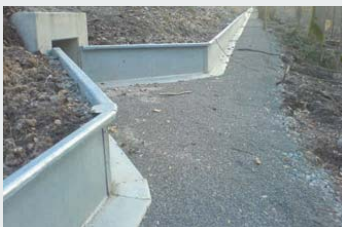
Stahl / Steel

We also supply permanent installations made of steel and concrete, with all accessories such as tunnels, stop drains and equipment for catching and counting of populations.