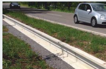
Beton / Concrete Sondervariante Laubfrosch-/Molchtauglich Special version proof for salamander and tree frog