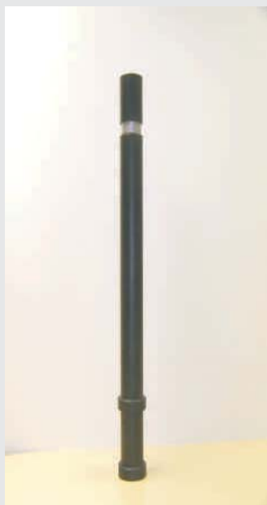
Gerade-Form straight form