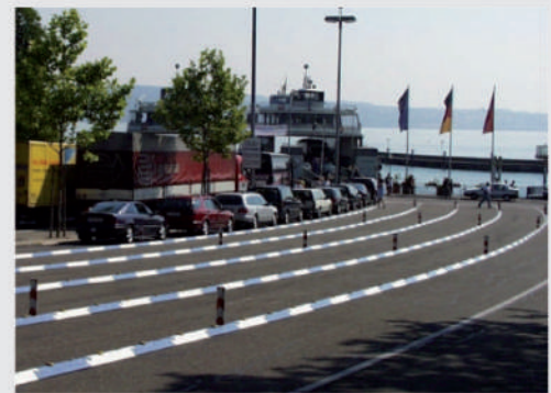
Wartespur-Trennung an einer Fähre Separation of queue-up lanes at a ferry

Die Leitschwelle ist sekundenschnell durch die Vater/Mutter-Verbindung montiert und wieder demontiert. Es kann ein Radius von mindestens 6 Grad verbaut werden. Dank speziellem Herstellverfahren keine Verformungsprobleme bei Wärme / Kälte. Durch Zugabe von Gummigranulat ist die Schwelle elastisch. Im Verbindungsbereich der Elemente werden beim Pressen zur Erhöhung der Festigkeit zusätzliche Versteifungen eingelegt. Ermittlung der optimalen, rutschfesten Form durch zahlreiche Anfahrtests.