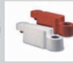
Mobiler Randstein mobile kerbs

Produkte für Leiteinrichtungen other guide systems