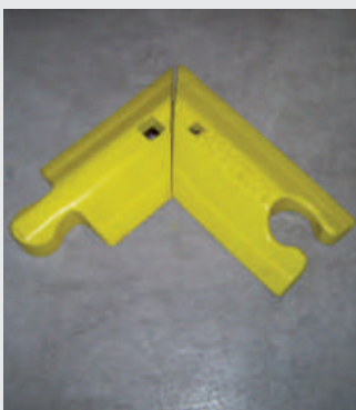
Winkelement – individuell auf Maß gefertigt Corner element - made individually according to request