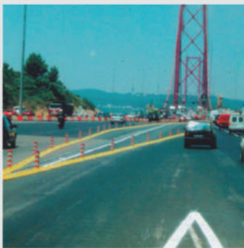
Zur Verkehrlenkung bei einer Autobahn-Zahlstelle To divert traffic in a toll station