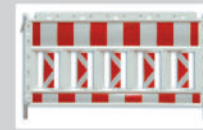
Absturzsicherung safety barrier