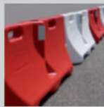
Leitwand guide wall

Produkte für Leiteinrichtungen other guide systems