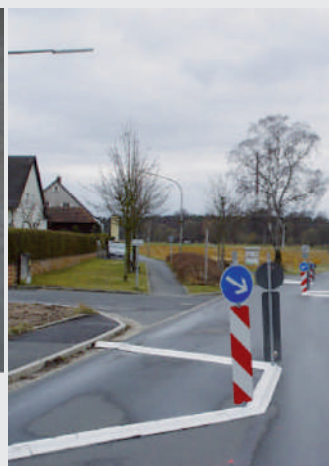
Winkelemente in einer Tempo-beruhigungszone Corner elements in a residential zone