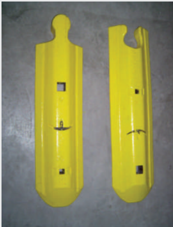
Abgeflachte Anfang- und Endstücke sichern beide Seiten eines Leitschwellenbandes ab. Flattened end pieces protect both sides of a guide barrier line.