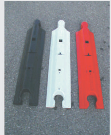
Standardfarben gelb und weiss. Andere Farben auf Anfrage. Standard colours yellow and white. Other colours upon request.