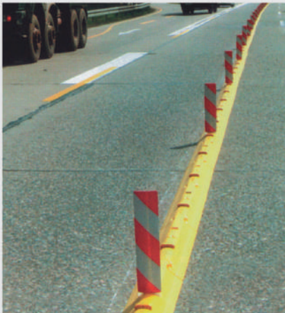
Fahrbahntrennung bei einer Autobahnbaustelle Lane marking in motorway roadworks