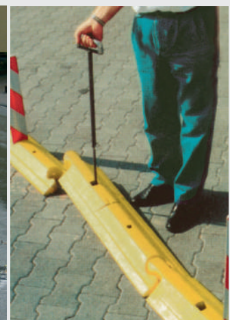
Problemloser Austausch mit Spezialhebewerkzeug Easy removal with special tool