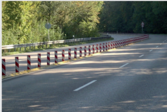
Fahrbahntrennung bei Überholverbot To prevent overtaking manoeuvres