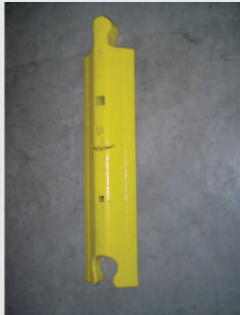
Material aus Recycling-Kunststoffen. Durch patentierte Formgebung optimal stand- und rutschfest. Material made of recycled synthetic. Optimum stability and non-slip through patented shape.