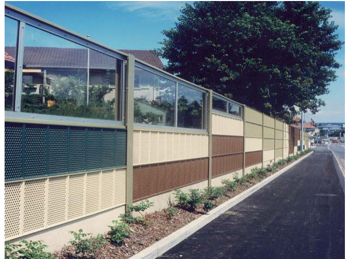
Lärmschutzwand mit Acryl an einer Spedition