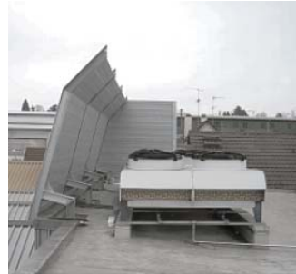
Lärmschutzwand vor Kühlaggregat

Die Elemente können reflektierend, ein- oder doppelseitig absorbierend geliefert werden.