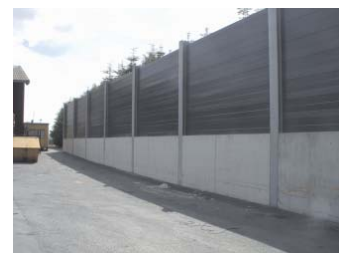
Lärmschutzwand an einem Firmenareal

MAIBACH VuL GmbH Bannholzstraße 4 D-73037 Göppingen-Voralb Telefon 0 71 61 / 99 76 0 Telefax 0 71 61 / 99 76 44 e-Mail: maibach@maibach.de