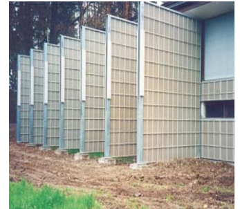
Lärmschutzwand an einer Schießanlage