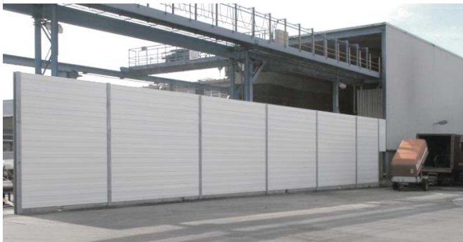
Lärmschutzwand an einer Wasser-Hochdruck-Reinigungsanlage